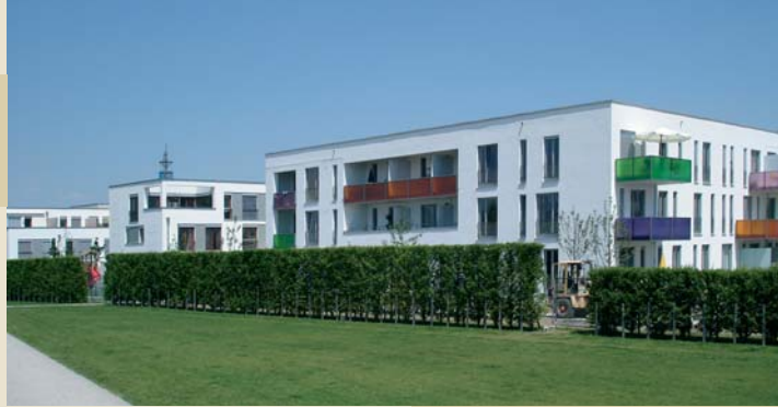
Bebauung und Grün, Raumkanten und Verknüpfungen