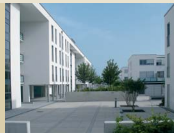
Private Stadträume: „Stadthof“