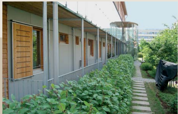
Individuelle Freiräume: geschützte Gartenzone, Balkone, Dachgärten, interne Eingangszone