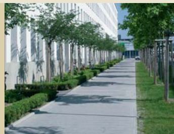
Öffentlicher Straßenraum, kleiner Straßenplatz, gemein- schaftliche Vorgärten auf Straßenniveau