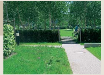
Öffentliches Grün: Verzahnung Bebauung-Grün, Platzsituation, Schnittstelle privat-öffentlich