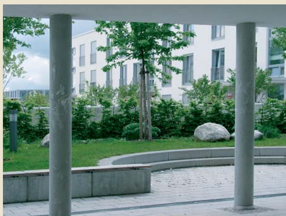
Private Stadträume: „Grünhof“