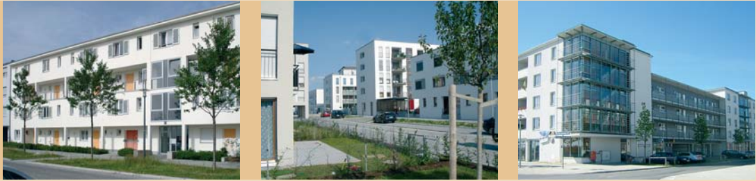
Straßenraumseite: Eingänge, Loggien, Nichtwohnnutzungen