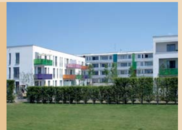
Farbe: „weiße Stadt im Grünen“ mit einzelnen Farbakzenten und Materialien