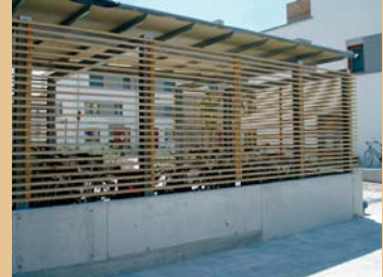
Wohnseite: Privater Freiraum, Balkone und Terrassen, Hofgebäude, transparente Nebengebäude