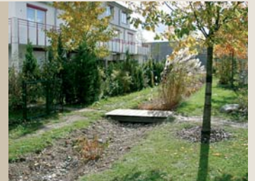
Hofräume: Gartenzone, Erschließungszone, Aufenthalt, Spielband, Sickergraben